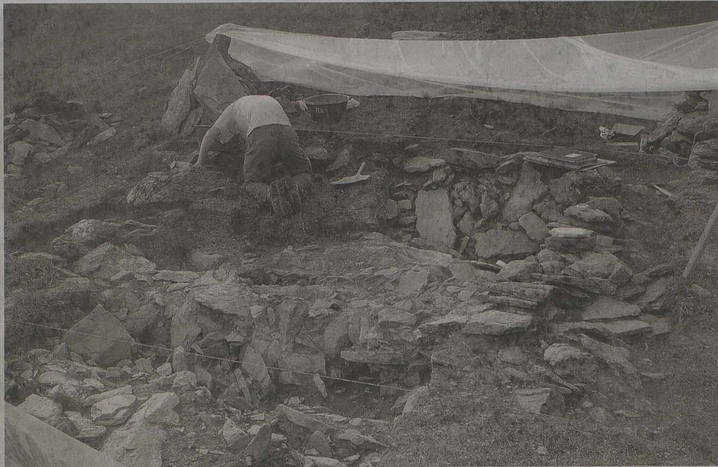
Sur les hauts de la commune de Liddes à 2650 mètres d'altitude, les archéologues ont procédé à de nombreux sondages pour mettre au jour l'ensemble du local. ROMAIN ANDENMATTEN